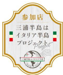
参加店シール (イメージ)